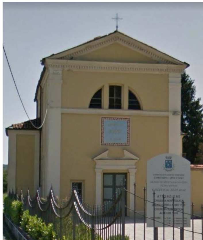
CHIESA CIMITERIALE MADONNA DEL TERIZZO