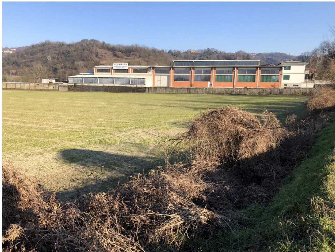
VISTA INTERNA DA SUD-EST