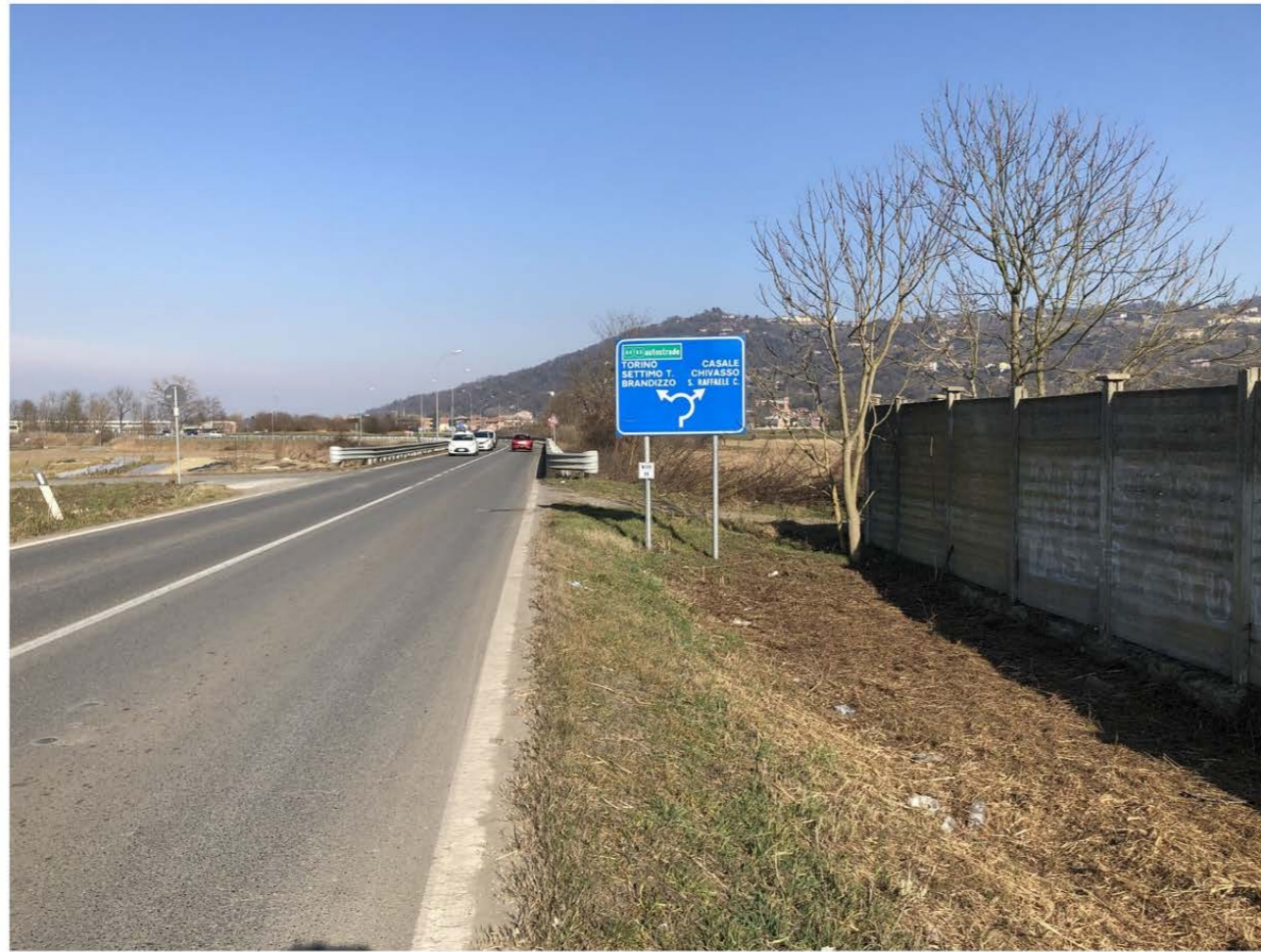
VISTA DA SUD SU VIA TORINO (SP590)