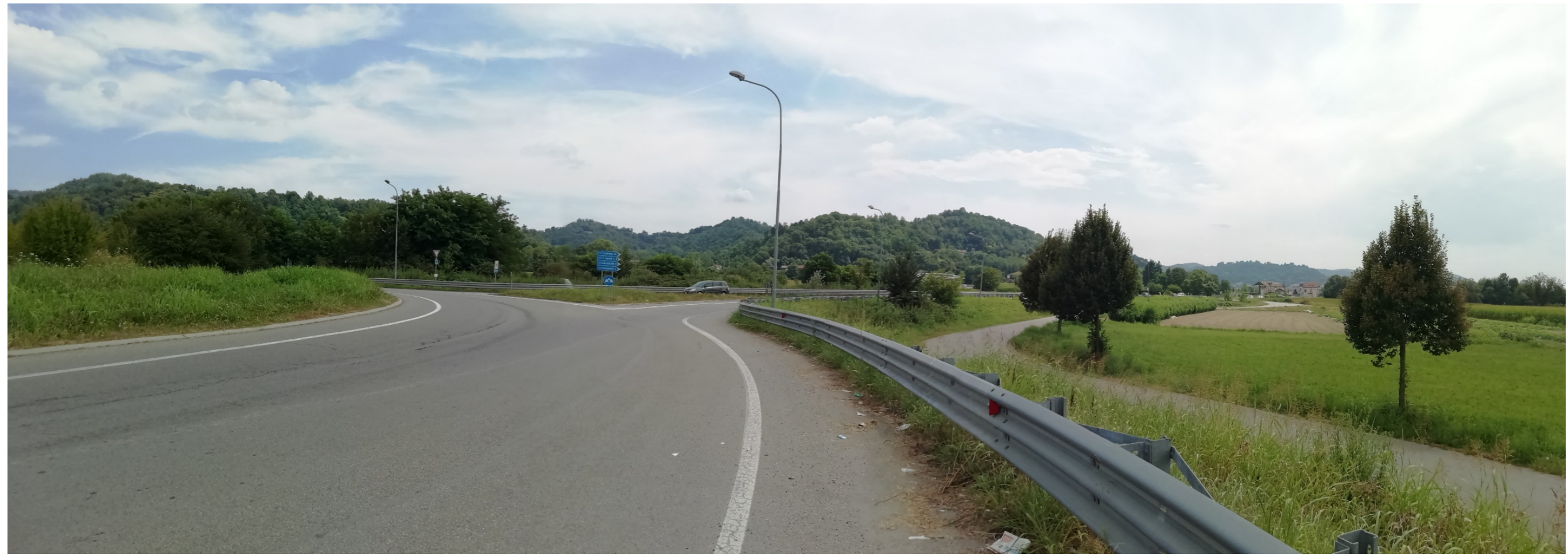
VISTA DALLA SP 590 TORINO - ALESSANDRIA