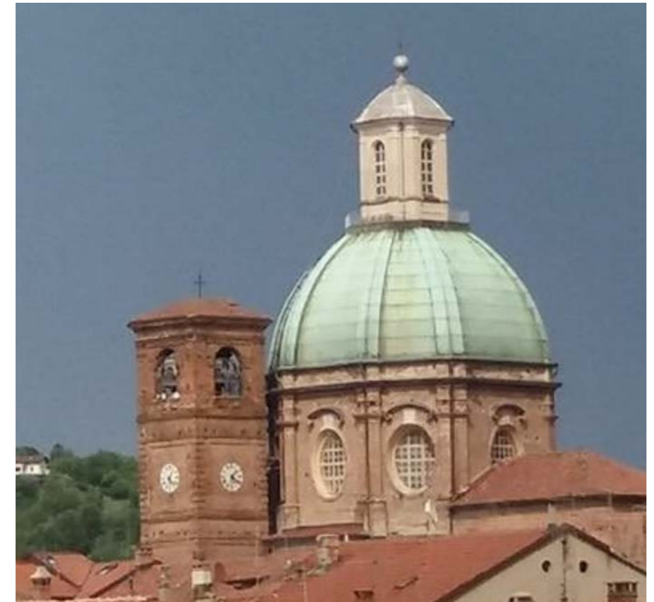
CHIESA CONFRATERNITA DELLO SPIRITO SANTO E VISTA CUPOLA