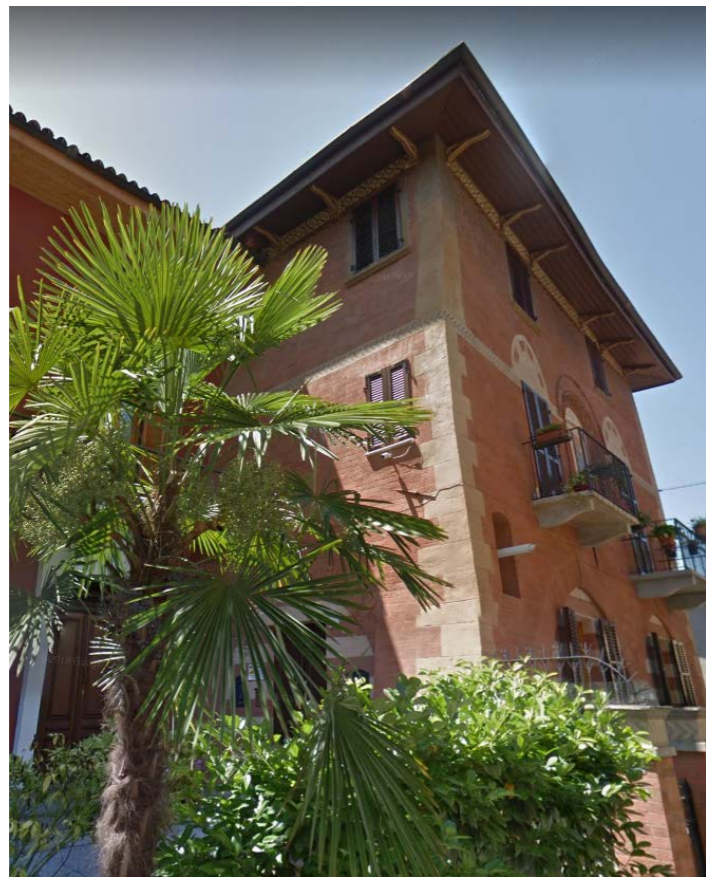
CASA CASTELLATA MEDIOEVALE (XIV)