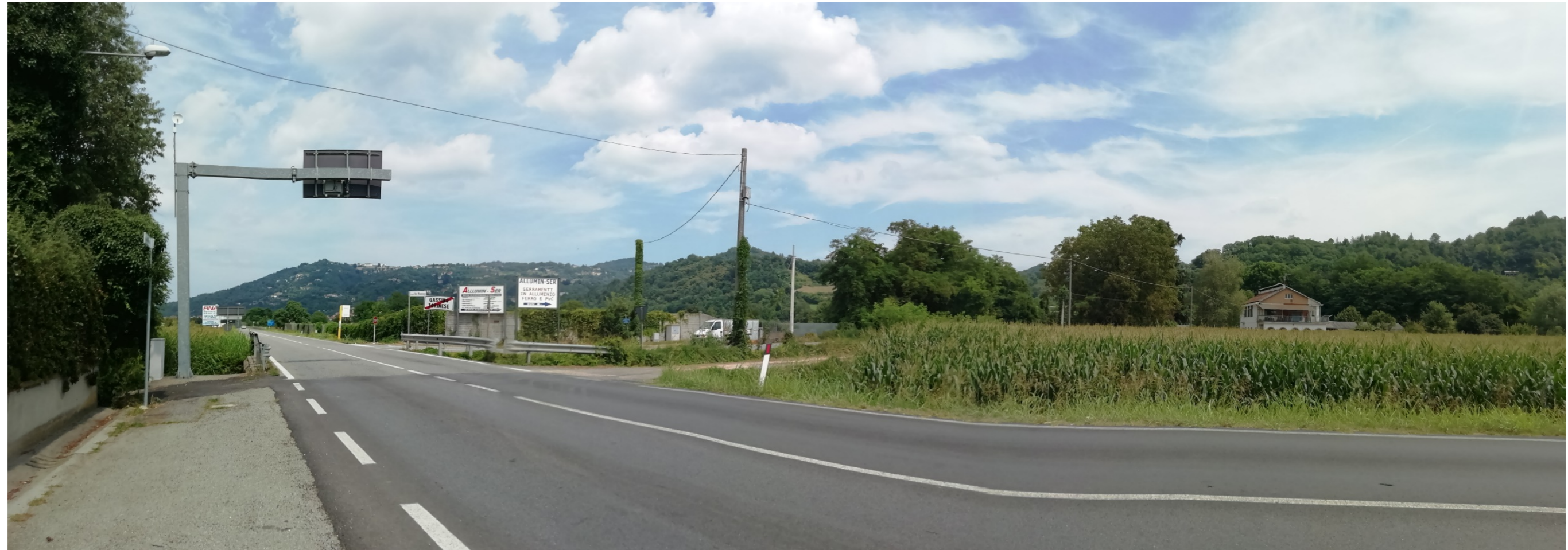
RELAZIONE PAESAGGISTICA – ANALISI DEL CONTESTO