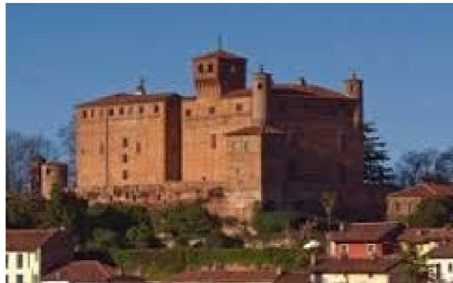
CASTELLO DI BARDASSANO