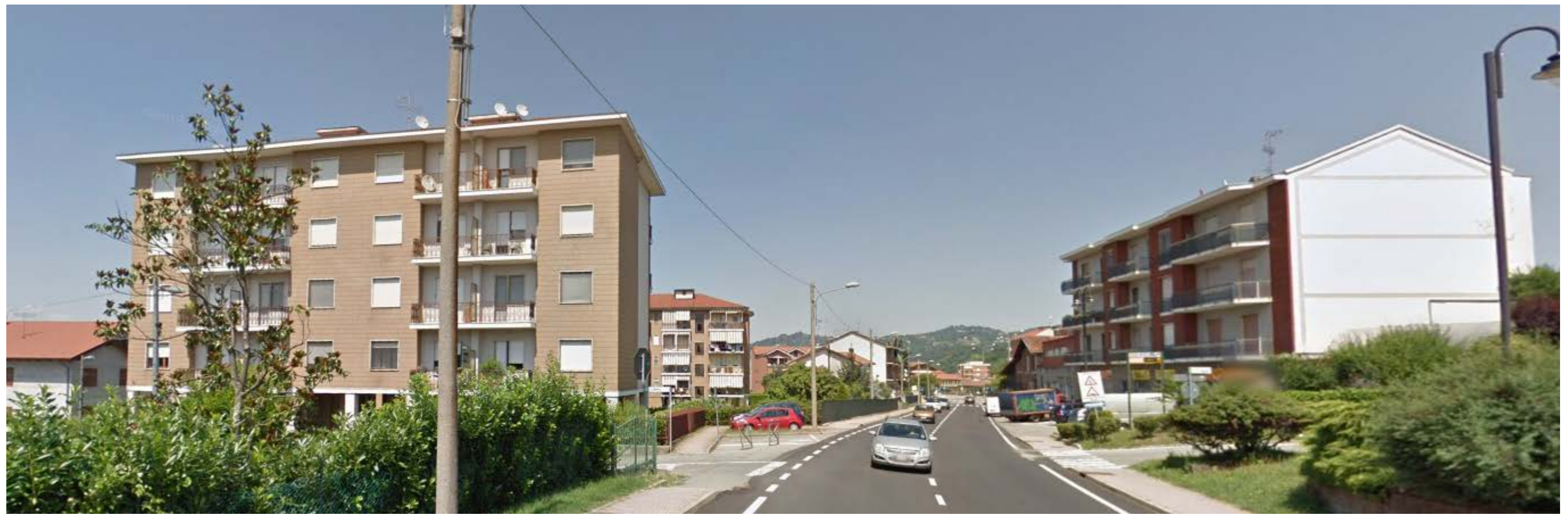
EDIFICI DI RECENTE COSTRUZIONE SU SP590