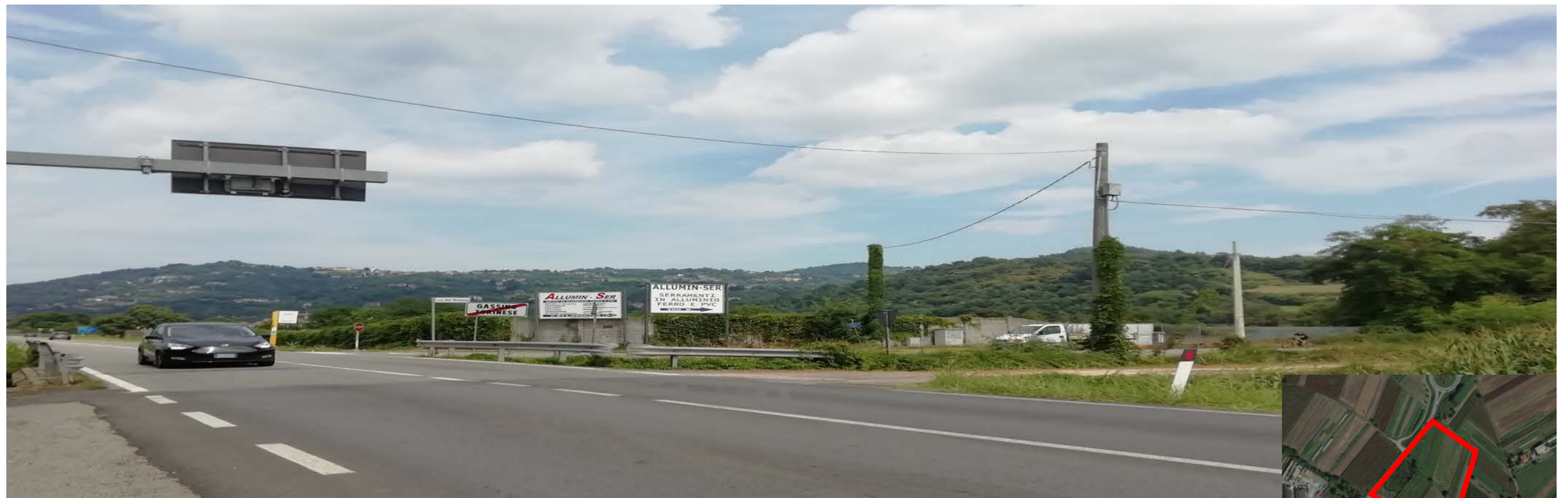
VISTA DA SUD-OVEST