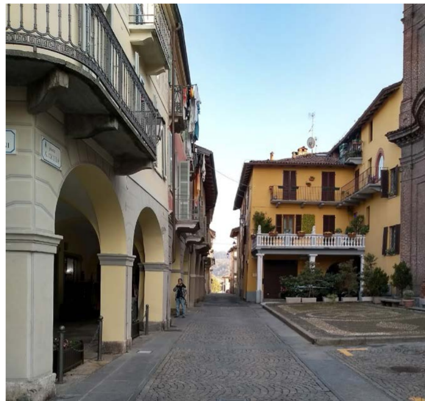
FRONTE EDILIZIO NEL CENTRO URBANO DI GASSINO TORINESE