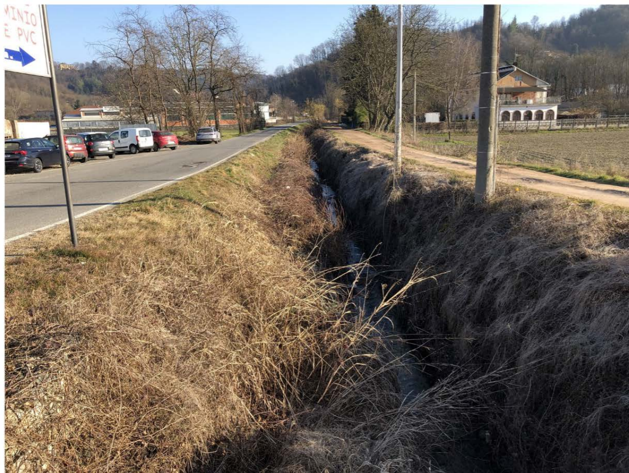
VISTA SUD SU STRADA VALLE BAUDANA