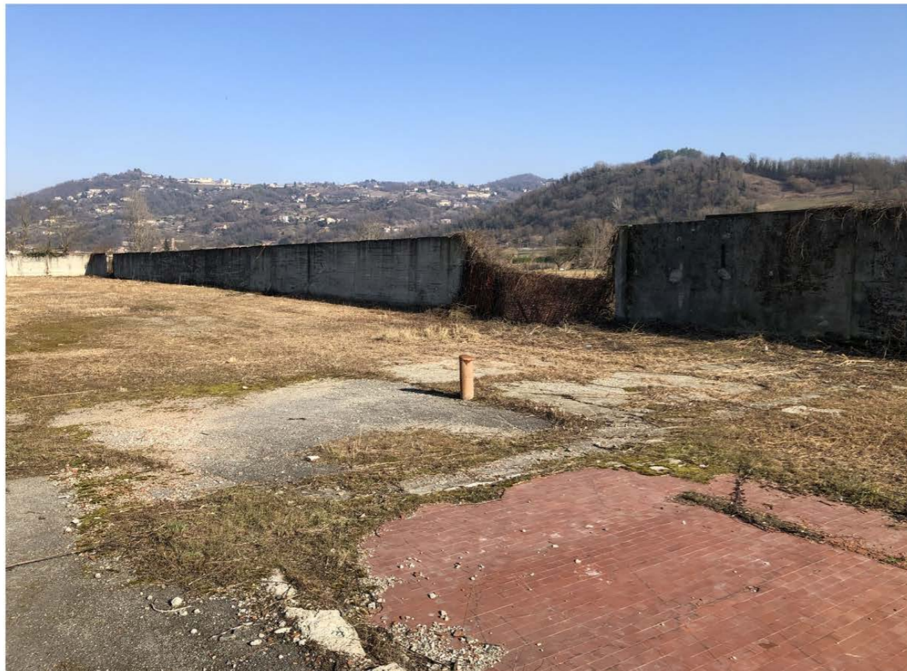
VISTA INTERNA DA SUD-OVEST