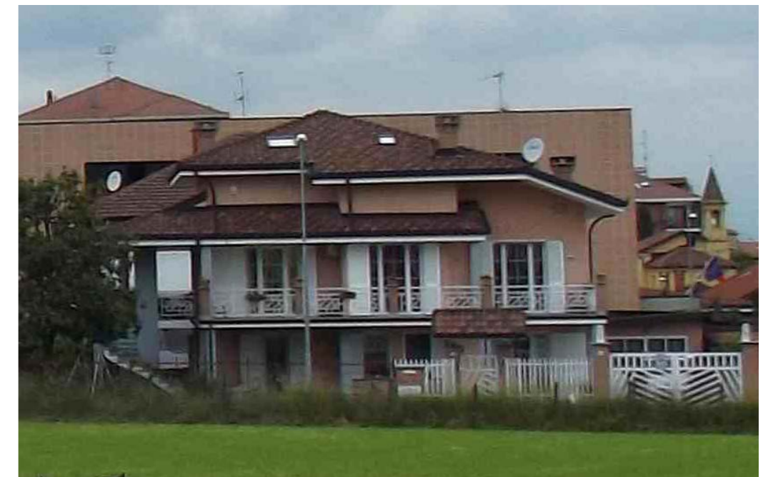
EDIFICI DI RECENTE COSTRUZIONE